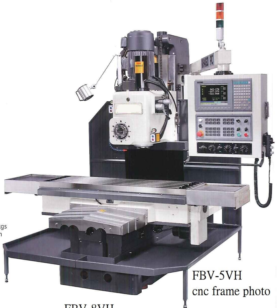
FBV-5VH cnc frame photo