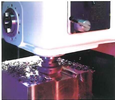
Vertical & Horizontal Head 立橫兩用銑頭

FBV-5VH / FBV-6VH / FBV-8VH / FBV-9VH-B / FBV-10VH